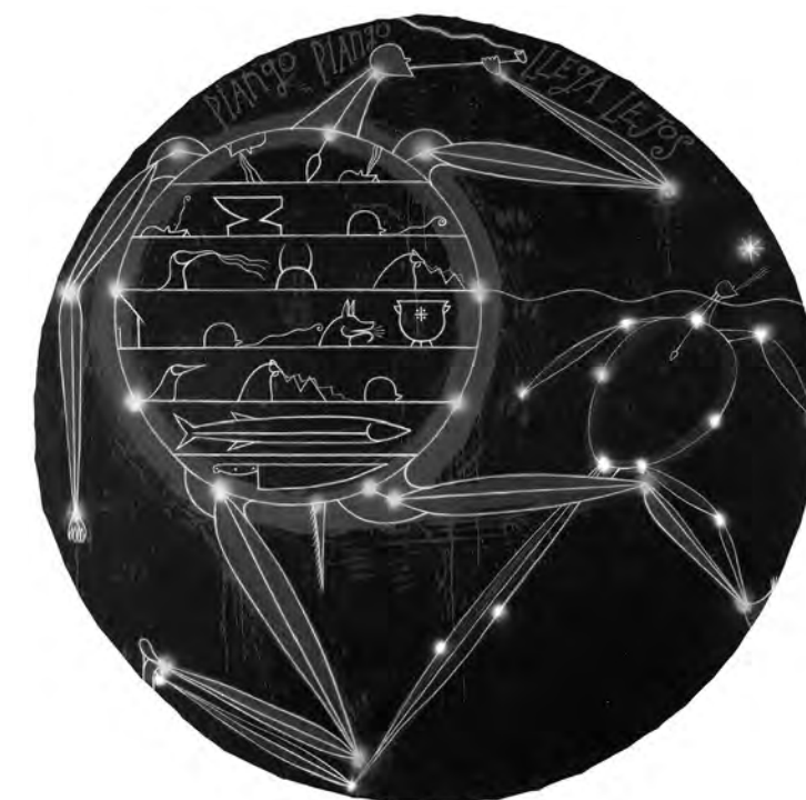
Piango piango llega lejos (Step by Step You Can Go Far), 2000. Acrylic stain and oil pastel on canvas, Diameter: 96-1/2". Collection of the Ackland Art Museum, The University of North Carolina at Chapel Hill, Ackland Fund.