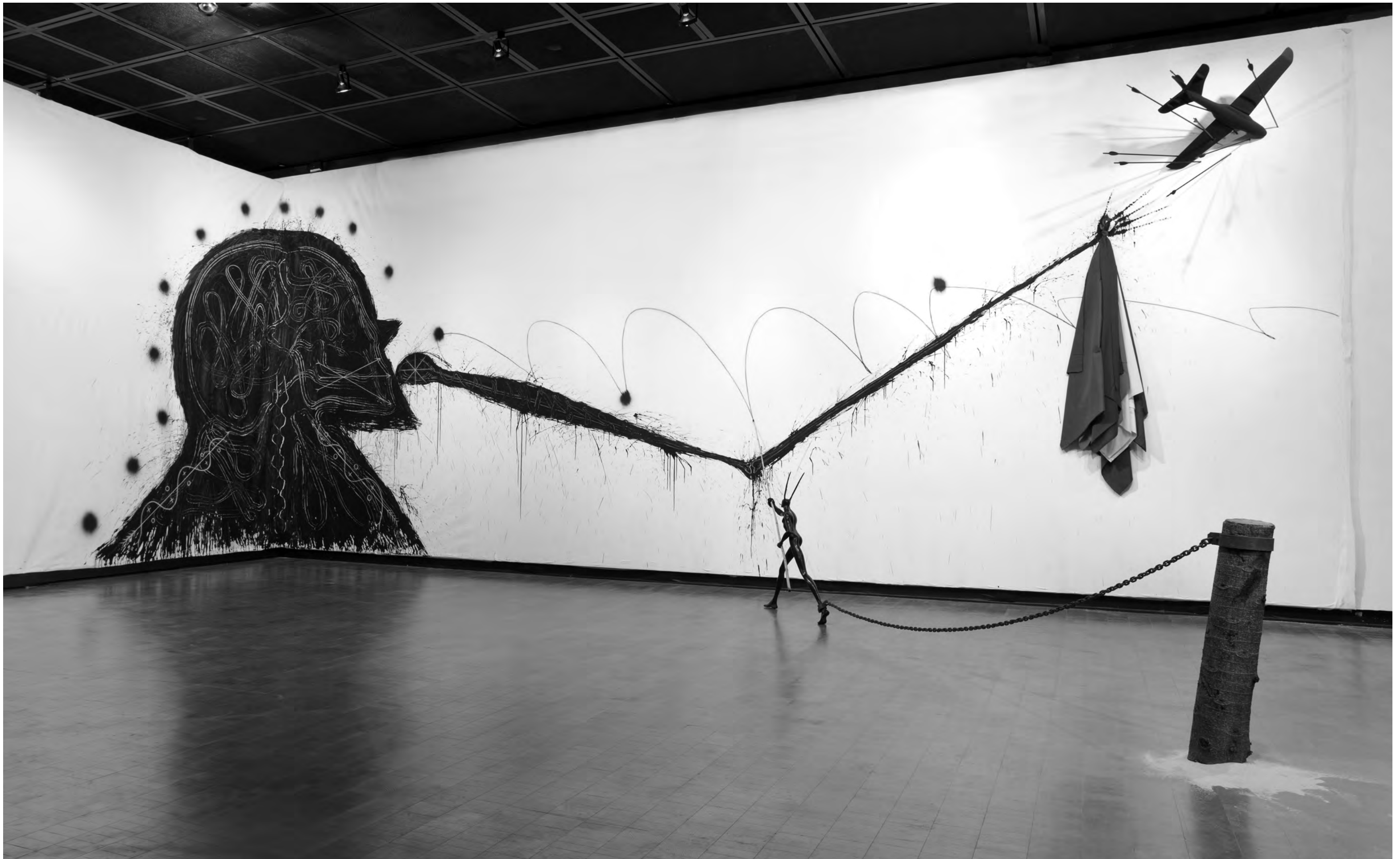
Installation view of Figura que define su propio horizonte ( Figure Who Defines His Own Horizon Line ), 2011. (from the exhibition Transcultural Pilgrim: Three Decades of Work by José Bedia , Fowler Museum at UCLA, 2011). Dimensions variable.