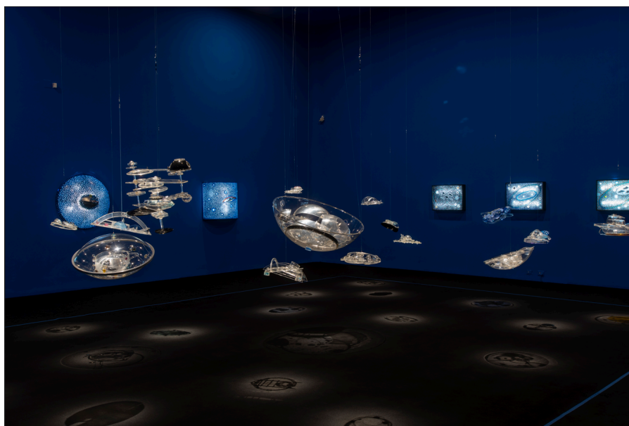
Vista de instalación: Gyula Kosice: Intergaláctico , Malba - Museo de Arte Latinoamericano de Buenos Aires, 2024.

Worlds Apart se presenta en tres capítulos, cada uno dedicado a una obra de video de un artista diferente: People's Limbo in RMB City (Limbo del pueblo en RMB City) de Cao Fei, Reality or Not (Realidad o no) de Cécile B. Evans y The Miracle of Helvetia (El milagro de Helvetia) de Guerreiro do Divino Amor. Cada video transporta a los espectadores a realidades alternativas donde los límites entre lo real, lo virtual y lo imaginado se desdibujan. En conjunto, estas obras exploran cómo los mundos contruidos—ya sean simulados, culturales o mitológicos—dan forma a nuestra comprensión de la identidad, el espacio y el poder.