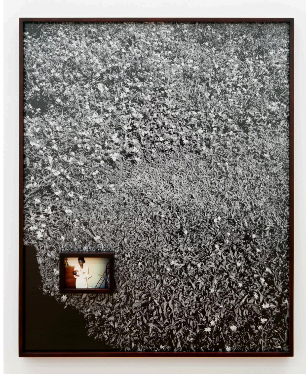
Widline Cadet. Sé Sou Ou Mwen Mété Espwa m #1 (En ti pongo toda mi esperanza #1), 2021. Impresión inkjet de archivo e impresión inkjet en marco de artista. 50 × 40 pulgadas. Colección del Pérez Art Museum Miami, compra del museo con fondos proporcionados por Joseph Wemple. © Widline Cadet