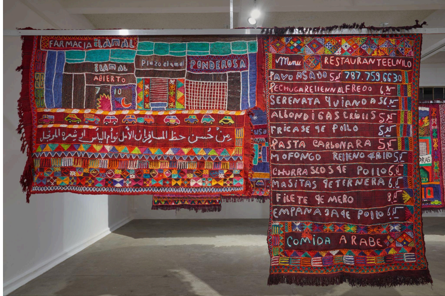
Alia Farid, Elsewhere (En otro lugar), 2023. Vista de instalación, Chisenhale Gallery, Londres, 2023.

25 de septiembre de 2025 – 27 de septiembre de 2026