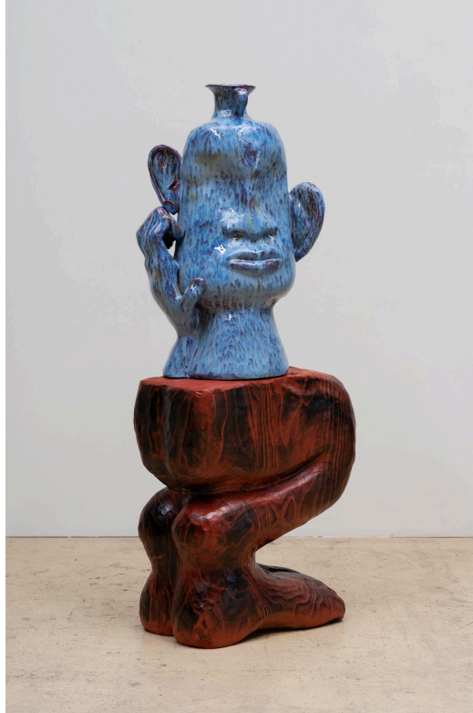
Woody De Othello, Ibeji , 2022. Colección Pérez Art Museum Miami, compra del museo con fondos proporcionados por Simi Ahuja y Kumar Mahadeva. © Woody De Othello. Cortesía del artista y Jessica Silverman Gallery. Foto: Eric Ruby.