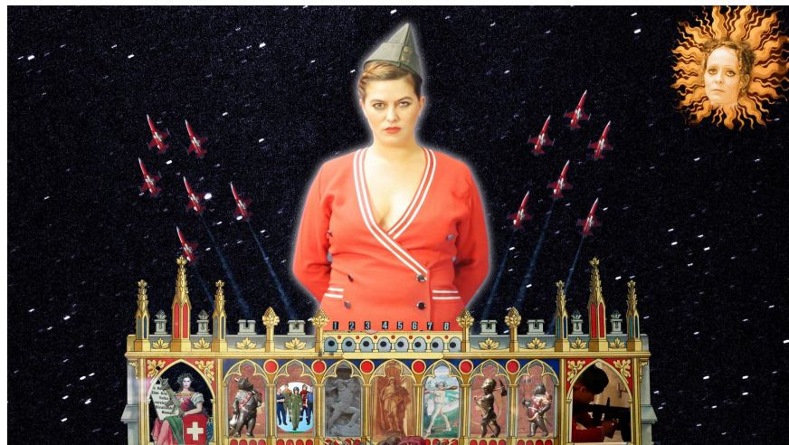
Guerreiro do Divino Amor. Fotograma de The Miracle of Helvetia (El milagro de Helvetia), 2022. Video a color, con sonido, 19 min., 34 seg.